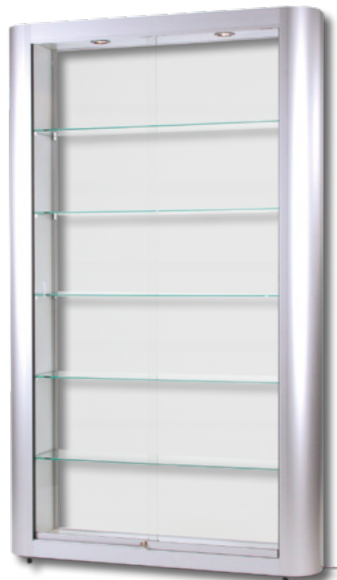
Modell 9 Standvitrine mit gewölbten Seitenprofilen