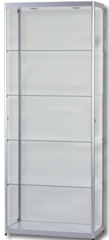
Modell 4 Standvitrine

Alle unsere Präsentations-Vitrinen liefern wir standardmäßig mit seitlichen, halbrunden Aluminiumprofilen (silber-eloziert) und stabilen Türscharnieren . Bei dem verwendeten Glas handelt es sich um ESG-Sicherheitsglas . Im Lieferumfang der Standvitrinen enthalten sind