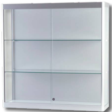
Modell 8 Wandvitrine

Andere Formate, Ausführungen und Farben sind bei größerer Auflage erhältlich!