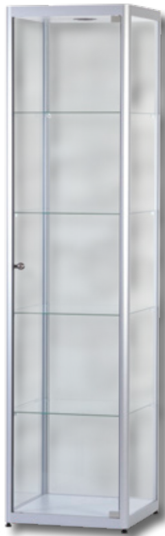
Modell 2 Standvitrine