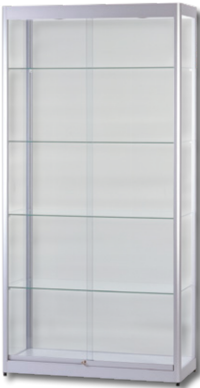
Modell 5 Standvitrine