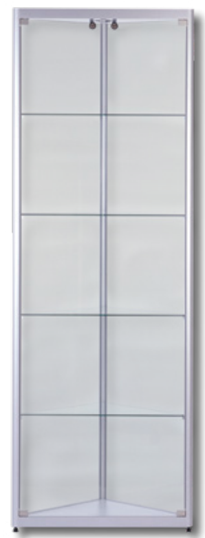
Modell 7 Eck-Standvitrine

Mit LED-Beleuchtung und/oder APOLLO-Schiene lieferbar!