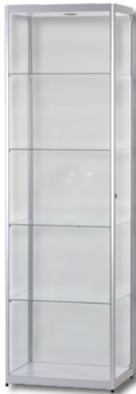
Modell 3 Standvitrine