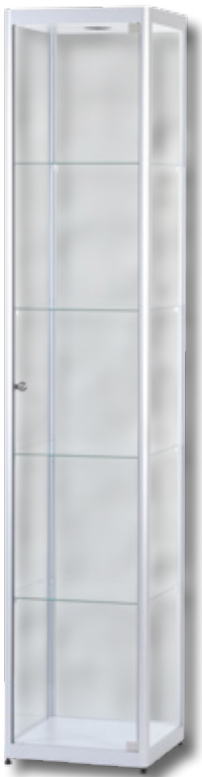
Modell 1 Standvitrine

Für Ihr Ladenlokal oder Ihre Sammelleidenschaft