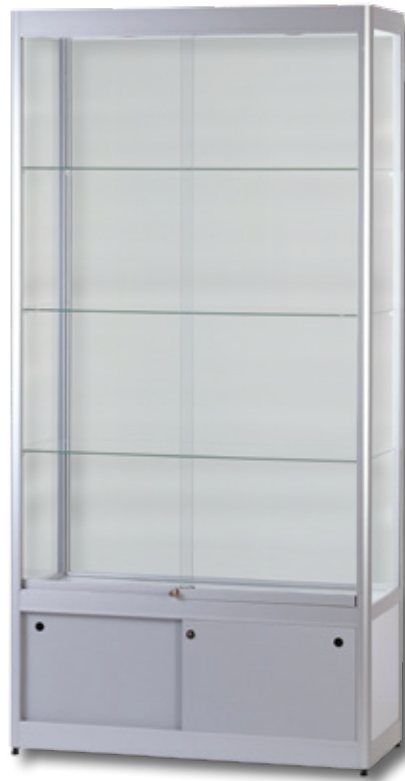
Modell 6 Standvitrine mit Unterschrank